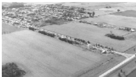
Foto: Máximo Paz esta rodeada por los monocultivos de soja.