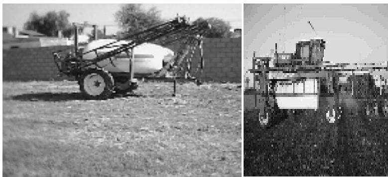
Fig. 2 y 3 Máquina de arrastre y mosquito

A diferencia del mosquito (Fig.3) y de las máquinas de arrastre (Fig.2), el avión (Fig.1) usa gotas muy pequeñas por su capacidad limitada de depósito, entonces tira prácticamente droga pura. Si para pulverizar una hectárea se necesita echar un litro de insecticida x, el avión por hectárea echa 1 litro más 4 litros de agua, es decir 5 litros por hectárea. En cambio un mosquito tira el mismo litro de insecticida por hectárea pero disuelto en 30, 40 o 50 litros de agua y la máquina de arrastre usa por hectárea 1 litro disuelto en 100 litros de agua. Esto significa que hay menos peligro de deriva. Es decir, el avión no debería utilizarse cuando hay un mínimo viento porque la gota es tan pequeña que un simple viento la puede llevar a un campo vecino o sobre personas o casas. El equipo de arrastre es el más seguro porque la gota es más grande.