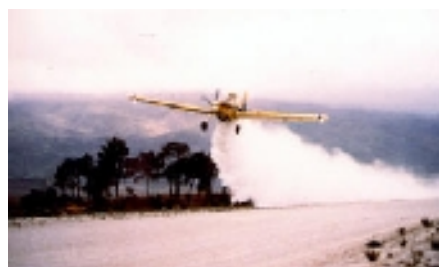
Fig.1 Avión fumigador

Normalmente los productos se aplican en forma de líquidos. Con respecto a esto, hay una expresión incorrecta cuando se usa la palabra fumigar ya que viene de humo –humo- y ninguna de estas máquinas hacen humo sino que son pulverizadores. Cuánto más pequeña sea la gota ese rocío se asemeja a un aerosol y mayor es la posibilidad de deriva que es una de las características de la pulverización del avión.