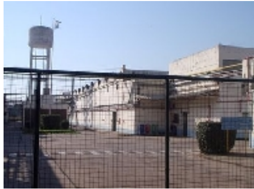
La planta de la ex Dupont, en avenida 40

La Fiscalía dio curso a la denuncia y realizó innumerables actuaciones, que culminaron el año pasado con análisis realizados por personal del Instituto Nacional del Agua (INA) que constató la existencia de hidrocarburos y nitratos en valores elevados en las napas. Lo actuado le brindó a la Fiscalía elementos suficientes para presentar una denuncia penal por entender que los denunciados habrían incurrido en delitos tipificados en la ley 24.051, de contaminación ambiental.